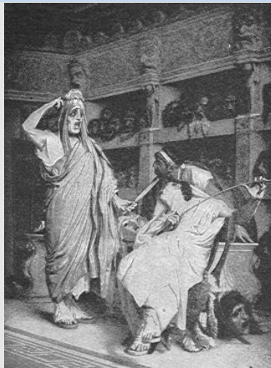
El actor se prueba la máscara.

En cambio, el drama y la prosa (bajo sus tres formas: oratoria , filosofía e historia ) llegan a su punto culminante, en estrecha vinculación con el surgimiento de la manifestación política más interesante y significativa de Grecia: la democracia .